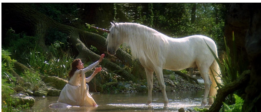
Legend, film de Ridley Scott (1985)