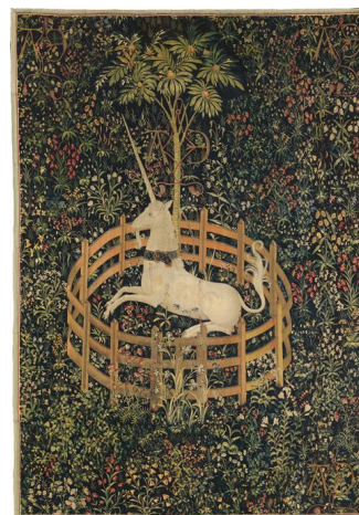
La Licorne captive, tapisserie de la série La Chasse à la licorne (vers 1500)

Le générique d'ouverture mémorable de La Dernière Licorne s'inspire justement de ces tapisseries précieuses. En invoquant des représentations réalistes de la licorne, le film nourrit le doute sur la réalité de cette créature magique dont on a longtemps cru, à travers les récits de voyageurs d'Europe et d'Asie, qu'elle avait existé.